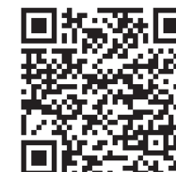
Google Play Store

To be able to use and parameterize the device with the Casambi app, it must be added to a network.