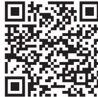
Google Play Store

Um das Gerät mit der Casambi-App verwenden und parametrieren zu können, muss es einem Netzwerk hinzugefügt werden.